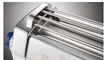
Protezione di Sicurezza