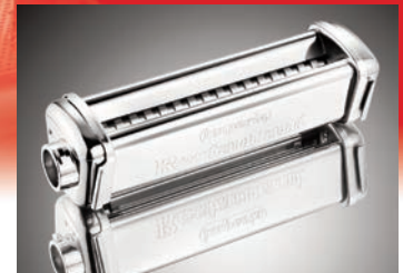
Nuovo innesto Simplex